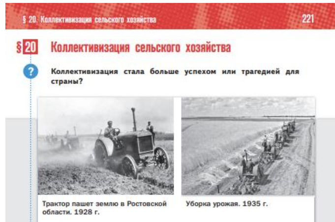
Figura 4 Livro Citado no Artigo

direcionada: “A coletivização foi um sucesso ou uma tragédia para o país?” (MEDINSKI, V. R.; 2024 p. 221).