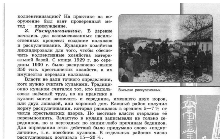
Figura 1 Imagem do Livro mencionado na pesquisa

Na sequência, o capítulo dedica-se a examinar a campanha contra os chamados kulaks , destacando inclusive a imprecisão conceitual do termo e reconhecendo que, na prática, a repressão atingiu numerosos camponeses que não se enquadravam originalmente nessa categoria. O texto observa que a classificação era frequentemente arbitrária e ampliada conforme as necessidades políticas do momento. A partir daí, o restante da seção concentra-se na descrição da violência do processo de coletivização, abordando deportações em massa, exílios internos, confisco de bens e destruturação das comunidades rurais. Também é mencionada a imposição de restrições à circulação, incluindo medidas que impediram camponeses ucranianos de deixar as áreas afetadas pela fome, reforçando o caráter coercitivo e repressivo das políticas implementadas naquele período (TORKUNOV, A. V; 2014, p. 136).